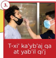
T-xi' ka'yb'aj qa at yab'il qi'j