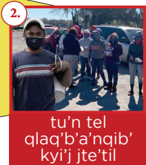
tu'n tel q'laq'b'a'nqib' kyij' jte'til